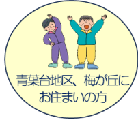
青葉台地区、梅が丘に お住まいの方